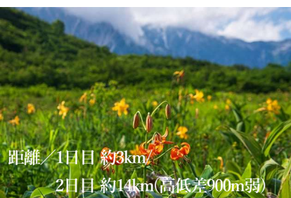
距離/1日目約3km 2日目約14km(高低差900m弱)