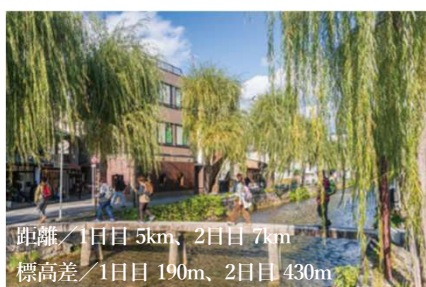
距離/1日目5km、2日目7km 標高差/1日目190m、2日目430m