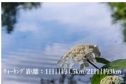
ウォーキング 距離：1日目約4.5km/2日目約3km