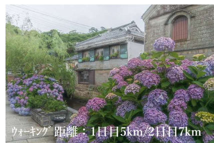
ウォーキング 距離：1日目5km/2日目7km