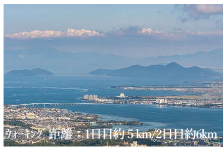
ウォーキング 距離：1日目約5km/2日目約6km